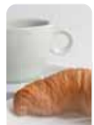
ACCUEIL CAFE & CROISSANTS

Manifestation gratuite sur présentation de cette invitation